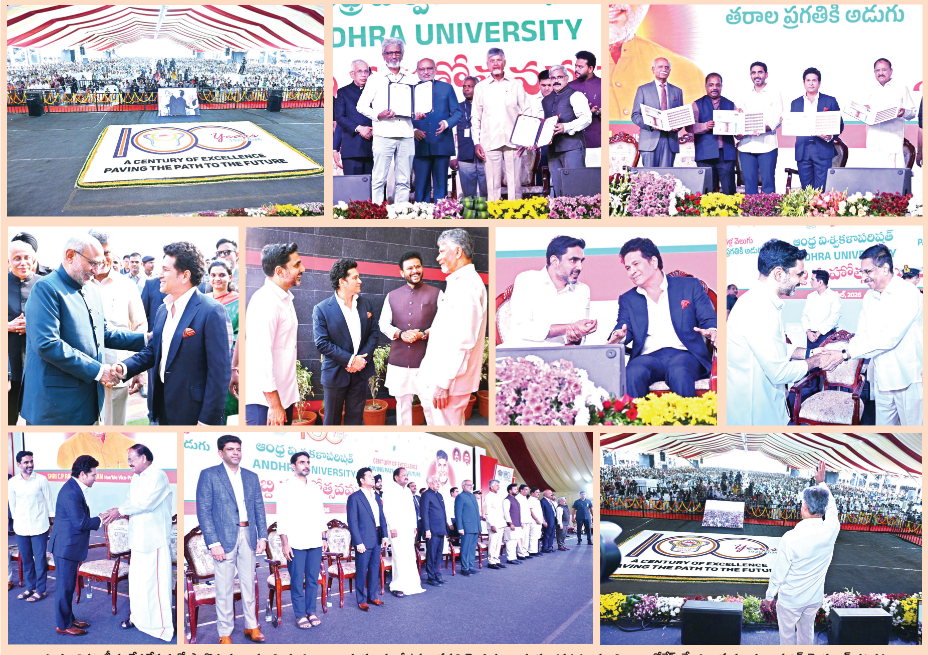
ఆంధ్ర యూనివర్సిటీ చంద్రేష్ వేడుక లో పాల్గొన్న ముఖ్యమంత్రి చంద్రబాబునాయుడు, మాజీ ఉప రాష్ట్రపతి వెంకయ్యనాయుడు, గవర్నర్లు, మంత్రి నారా లోకేష్, కేంద్ర, రాష్ట్ర మంత్రులు, సచిన్ టెండూల్కర్ తదితరులు.