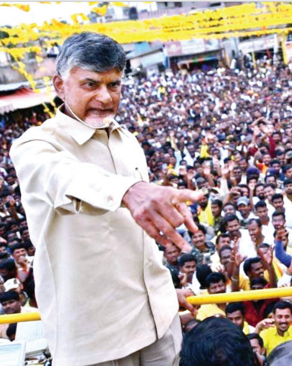
చంద్రబాబు నాయుడు ప్రసంగం.

2024లో చంద్రబాబు ఆంధ్రప్రదేశ్ రాష్ట్ర ముఖ్యమంత్రిగా అధికారం చేపట్టినప్పుడు రాష్ట్రం చూడాలి స్థితిలో లేదు. రూ. పది లక్షల కోట్లకు పైగా అప్పులు, అగిరియిన రాజధాని, పారిపోయిన పెట్టుబడులు, ఖాళీగా పడి ఉన్న పరిశ్రమల స్థలాలు. ఇవి వారసత్వంగా వచ్చిన సమస్యలు. ప్రభుత్వ ఉద్యోగుల జీతాలు ఇప్పడూనే కట్టడం స్థితిలో రాష్ట్ర ఖజానా ఉంది. సంక్షేమ పథకాలు సడపాలి, అప్పులపై పడ్డి కట్టాలి, అభివృద్ధి పనులు చేయాలి. కానీ దబ్బు లేదు. ఇంత కష్టమైన స్థితిలో ఒక రాష్ట్రం బయటపడే దారి ఒక్కటే. సంపద స్వచ్ఛందం. సంక్షేమం తగ్గించలేదు, జీతాలు ఆపలేదు, పడ్డీలు పడలేదు. మిగిలిన దారి ఒక్కటే. పరిశ్రమలు రావాలి, పెట్టుబడులు రావాలి, పన్ను ఆదాయం పెరగాలి. ఇది నిర్ధారించే కాదు, మనుగడకు అవసరమైన గణితం.