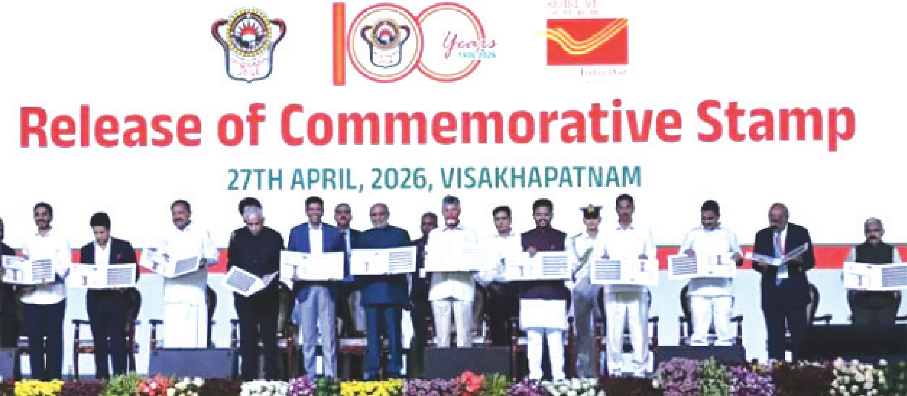
ఆంధ్ర విశ్వవిద్యాలయం నూరేళ్ల పండుగ సందర్భంగా సావనీర్ ఆవిష్కరిస్తున్న అతిథులు